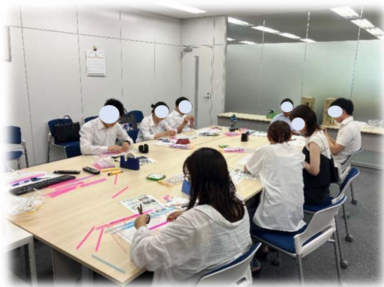
橋梁実習：ストローブリッジ作成風景